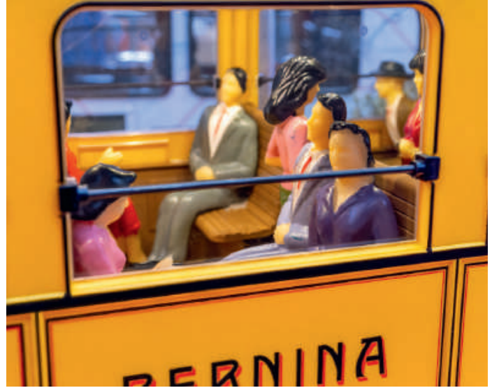
Voller Leben: Bis zu 20 Figuren pro Wagen – wie hier im Triebwagen ABe 4/4 30 (oben) oder im Golden Pass-Wagen der MOB (unten) – erzählen viele kleine Reisegeschichten.

An einer Stelle der Anlage, die sich wie ein großes „U“ mit angesetztem gestreckten L-Schenkel in den Raum ausbreitet, erhebt sich der Leitstand mit vier Bildschirmen. Sie können Bilder von acht Videokameras, die auf der Anlage platziert sind, anzeigen. Damit behält der jeweilige „Bahnchef“, der an einem Besuchstag (regulär von Mai bis Oktober jeden Sonntag und an Feiertagen von 10.00 bis 16.00 Uhr) seinen Dienst schiebt, den Überblick. So kann er sehen, wie sich die Züge durch die Bahnstadt bewegen, über die Abwärtsrampe auf die Fahrstrecke oder auf die Abstellgleise einen Stock tiefer fahren. Das Besondere dabei: Die Fahrstraßen im „Souterrain“ sind dank Plexiglasscheiben voll einsehbar und dadurch sehr beliebt bei den Kindern, die sich hier auf Augenhöhe die vorbeiziehenden Züge anschauen können. „Die Anlage verfügt über rund 950 Meter Gleise mit 155 Weichen auf einer Gesamtfläche von 300 Quadratmetern“, umreißt Jürgen Drexler die Größe der Anlage. Bis zu 16 Züge verkeh-