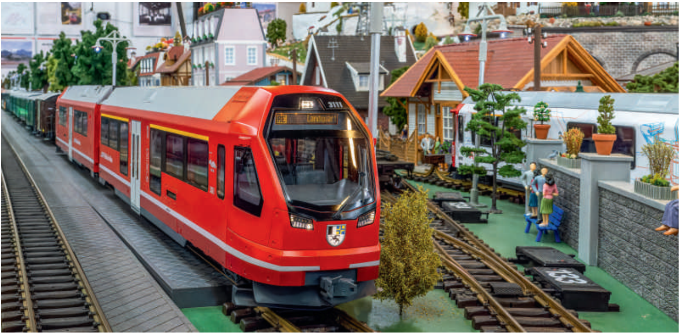
Topaktuell: Auch das jüngste LGB Modell, der „Capricorn“ Nummer 3111 ist auf der Anlage in Augsburg unterwegs.