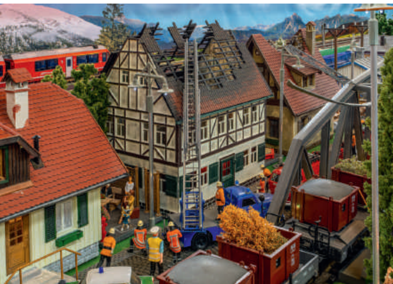
Action: Die „brennenden Häuser“ fordern die Einsatzkräfte.