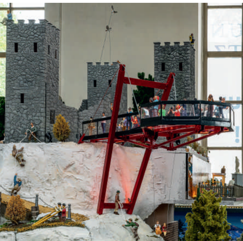
Blickfang: Seit Kurzem thront ein „Skywalk“ über der Stadt.