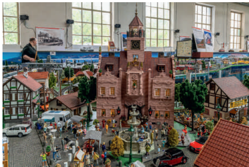
Markant: Rathaus und Springbrunnen dominieren die Stadtszene.