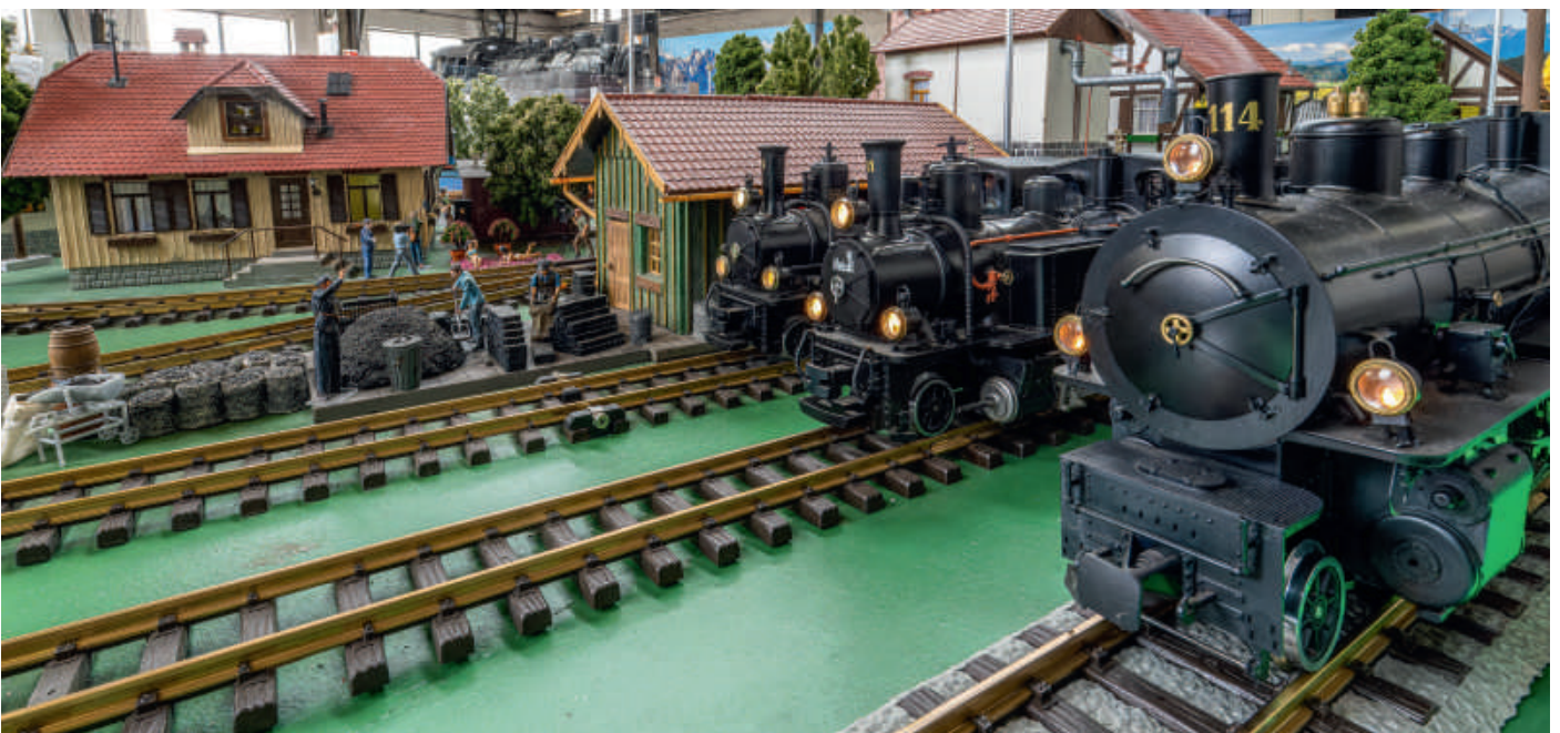
Stars: Sie stehen für die Epoche I und Dampfloklära der RhB (von links): G 3/4 Nr. 8 „Thusis“, Ge 3/4 „Heidi“ und die G 4/5 Nr. 114.