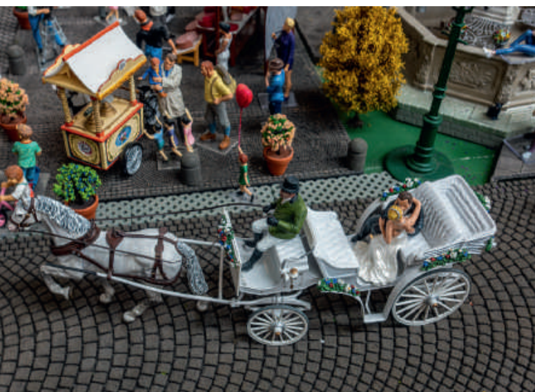
Traumhaft: das Brautpaar in der weißen Hochzeitskutsche.