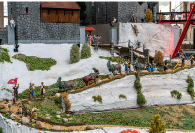
Szenenreich: Großer Almbetrieb, aber ein Kuh schert aus.