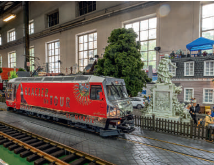
„Glacier on Tour“: die Sommerneuheit der LGB aus dem Jahr 2017.