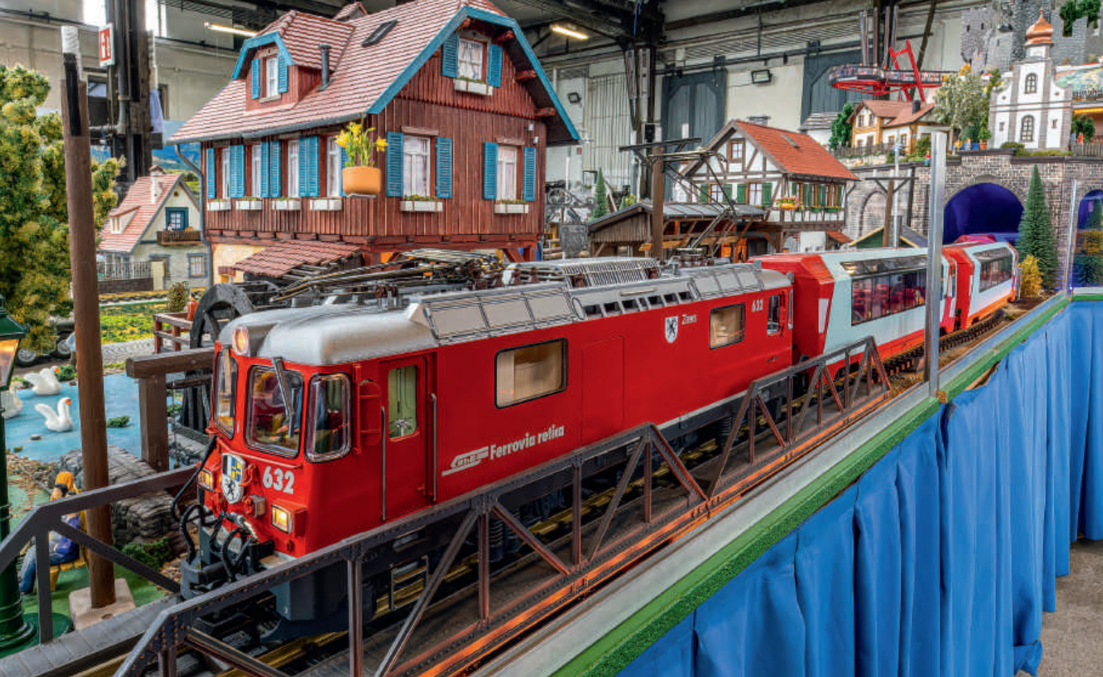
Typisch RhB: Der GlacierExpress mit den Panoramawagen in der Ausführung Rot/Gletscherblau – hier gezogen von einer Ge 4/4 II.