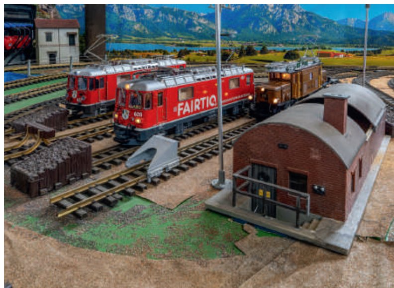
Ruhe: Bernina-„Krokodil“ und zwei Ge 4/4 II warten auf ihren Einsatz.