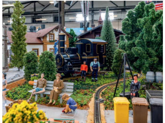
Akzent: das Jim-Knopf-Set – ein Hingucker im RhB-Universum.