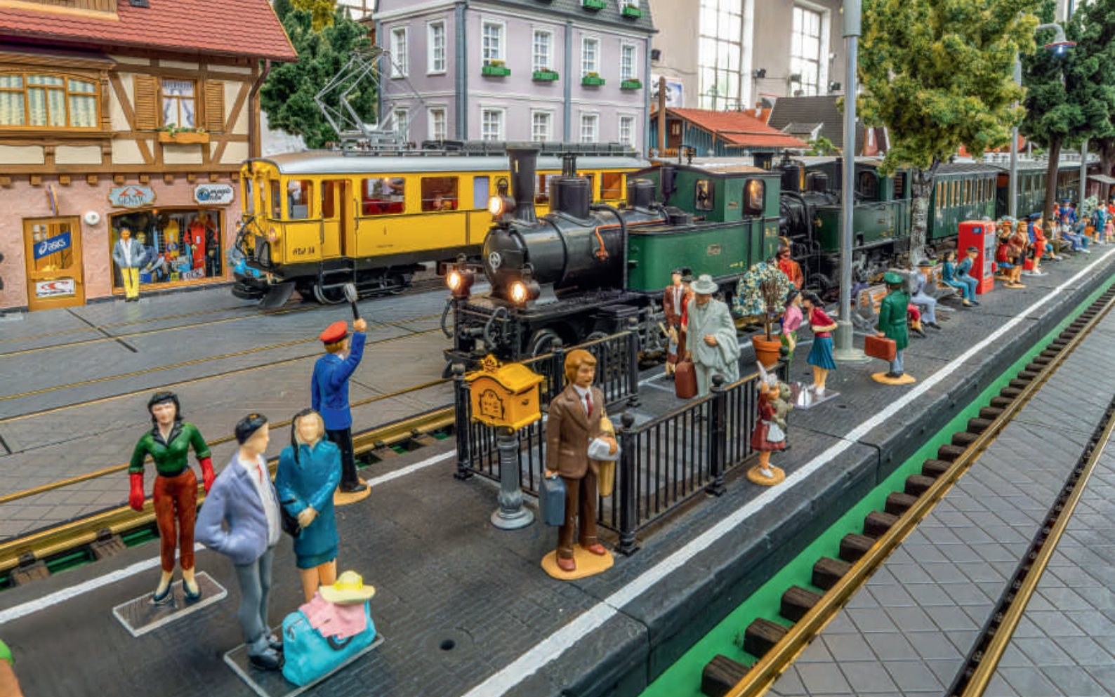
Ankunft, Abfahrt: Der Bahnsteig des zentralen Durchgangsbahnhofs ist 14 Meter lang und jeder der vielen Reisenden ist ein Unikat.